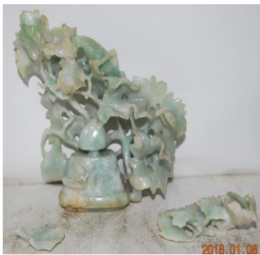
20. 玉雕擺飾 B