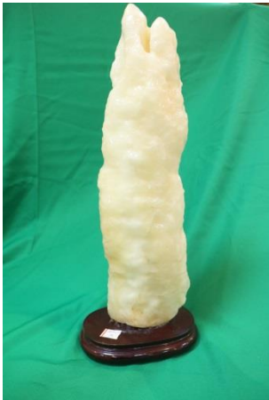
16. 鐘乳石 B