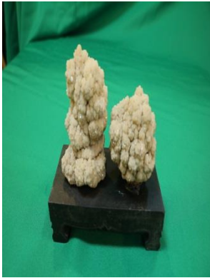
13. 鐘乳石原礦 擺件