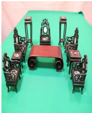
2. 木製仿古家具擺飾