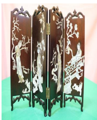
5. 仕女圖木製迷你屏風