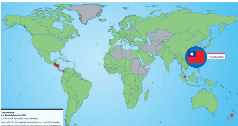
(每一個紅點代表一個已簽署或洽談中之FTA)