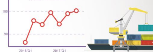
台灣對外貿易依存度

106年台灣貿易依存度超過100%， 產業結構以製造業為首，對貿易有非常高的需求。