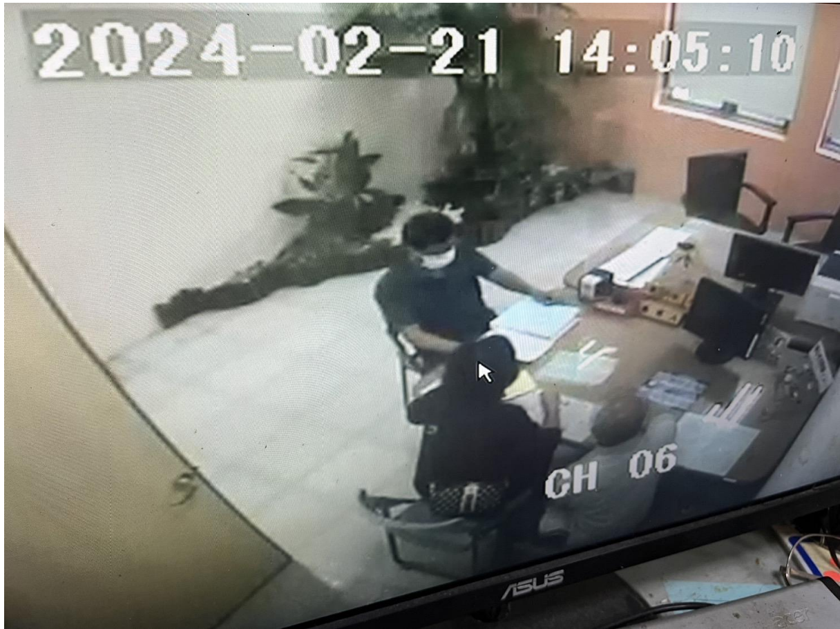
義務人家人至宜蘭分署繳清罰鍰