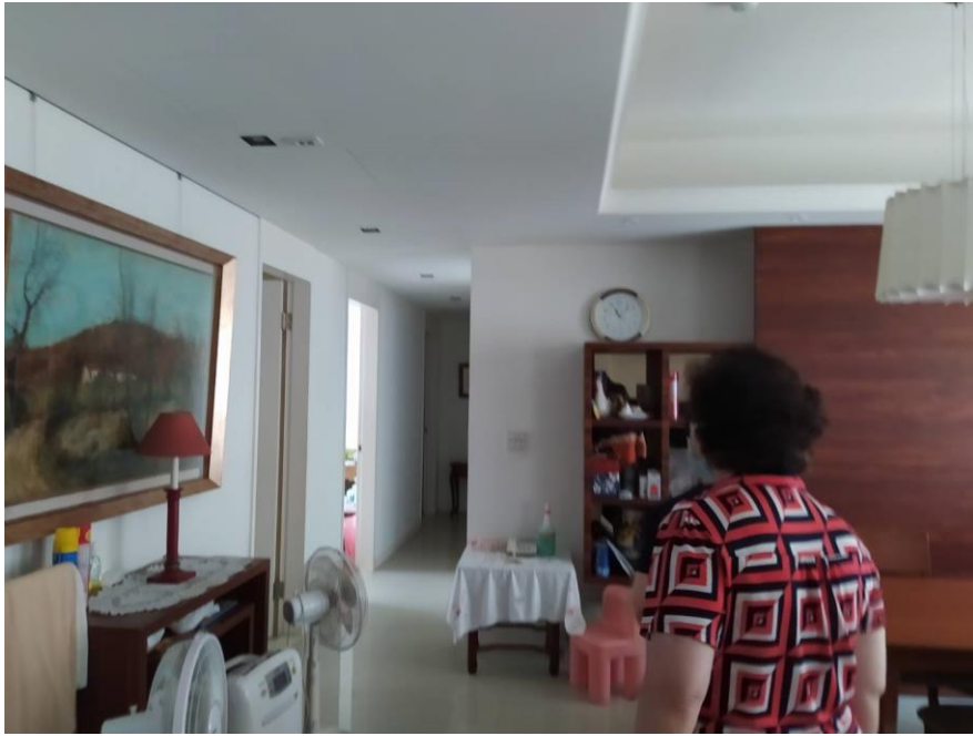
(上圖：法務部行政執行署宜蘭分署 112 年 9 月 4 日上午 11 時於基隆辦公室即基隆市東信路 169 號 7 樓舉辦聯合拍賣會，拍賣基隆市暖暖區暖暖街 337 號 5 樓建物畫面)