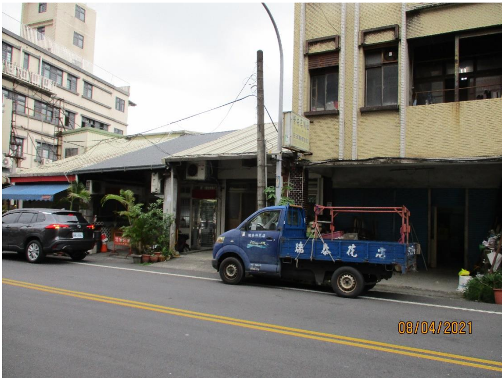
(法務部行政執行署宜蘭分署 112 年 9 月 5 日下午 3 時於宜蘭市中