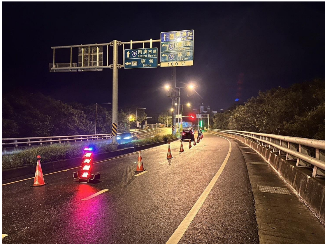
圖 1：非本案照片，為酒駕臨檢示意圖。