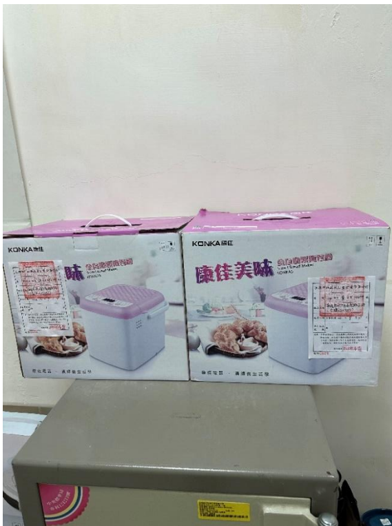
(上圖：法務部行政執行署宜蘭分署 112 年 12 月 5 日週二下午 3 時於宜蘭市中山路二段 261 號舉辦聯合拍賣會，拍賣充電吸塵掃地機、麵包機等畫面)